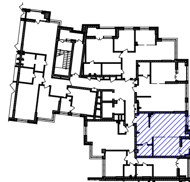
План 12,13,14-го поверхів